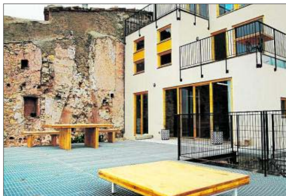
Terrazas privilegiadas.

tas de cultura contemporánea en lugares no habituales, utilizando formatos poco conocidos, implicando personas y entidades de la comarca, etc.). Y, ya por último, una de las máximas más significativas: “descentralizar para centralizar desde una nueva periferia”.