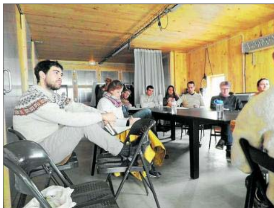
Taller de arquitectura sostenible. FOTO: M. C.

“Addend” no se puede entender sin la existencia de “Priorat Centre d’Art” (2006-2013), que se configuró con la intención de vincular arte y cultura contemporánea con la comarca del Priorat. Sin recibir apenas apoyo por parte de las instituciones, la programación se basaba en la producción: invitar a artistas para que hicieran propuestas vinculadas con el territorio. Con todos estos años de recorrido y ya muchos que llevaban anteriormente, el modus operandi de “Comissariat” queda imprimido de manera natural en “Addend”. A continuación, algunas claves de este carácter: la autogestión y la financiación privada (por un lado, debida al poco apoyo recibido por parte de las instituciones; por otro, debido a la independencia que supone, aunque también precariedad). Tal y como lo describe Francesc Perramon en un texto sobre Vidal: sus acciones tienen mucho de “guerrilla artística”, debido a su carácter crítico y a situarse fuera de lo que él nombra el “establishment local/cultural”; esto provoca que, tal y como comenta el propio Vidal, realicen un trabajo de trinchera desde el Priorat, experimentando con lenguajes y formatos. El “ultralocalismo” permite generar propuestas de lo que llaman “ardal autóctono”, en las que hay una conexión entre el trabajo de los artistas y el territorio. Este contacto conlleva una pátina pedagógica (en la difusión de propues-